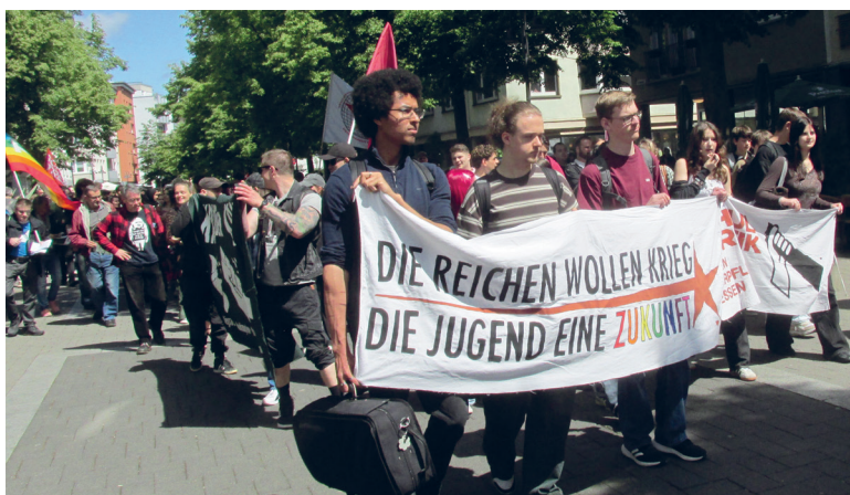
Schulstreik am 8.5. in Gießen

Statt sich ernsthaft mit diesen Forderungen auseinanderzusetzen, wurde schnell versucht, die