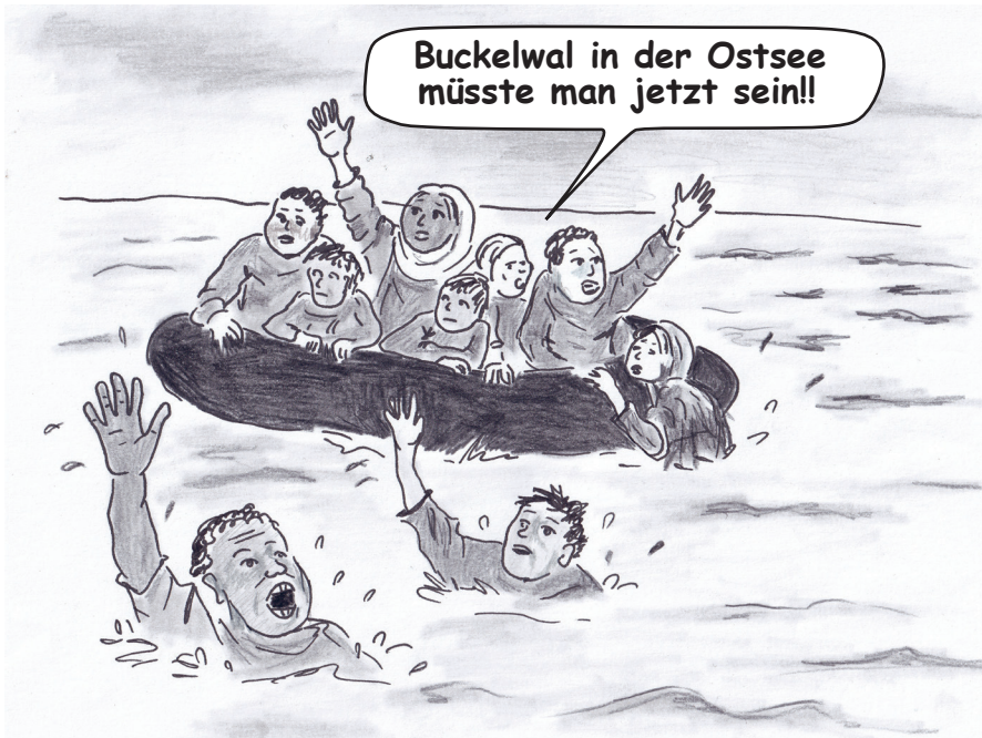
Irgendwo im Mittelmeer