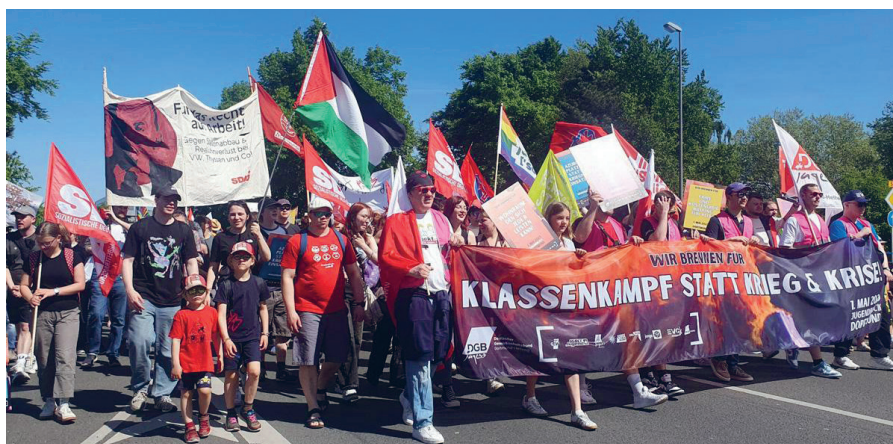
„Wir brennen für Klassenkampf statt für Krieg & Krise“ (1. Mai 2025 in Dortmund)

Gegen den Druck hilft nur eins: Klassenkampf! In den Betrieben! Mit politischen Fragen auf der Straße! Immer mehr Kolleginnen und Kollegen wird klar, dass nicht „Partnerschaft“ zwischen Kapitalisten und Arbeitern, sondern der solidarische Kampf von uns Arbeitern eine Antwort liefert. Nicht Kungelei mit Kapital und Kabinett halten die