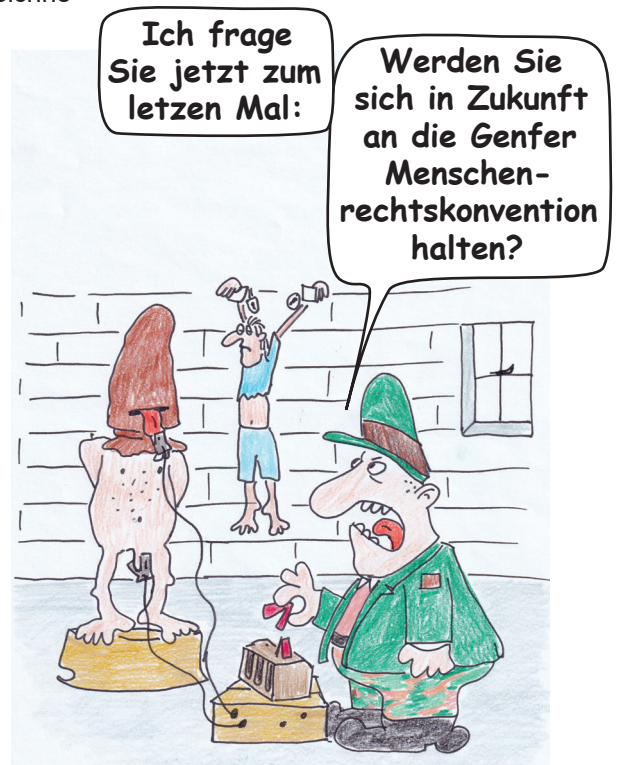
Westliche Wertegemeinschaft bei der Arbeit