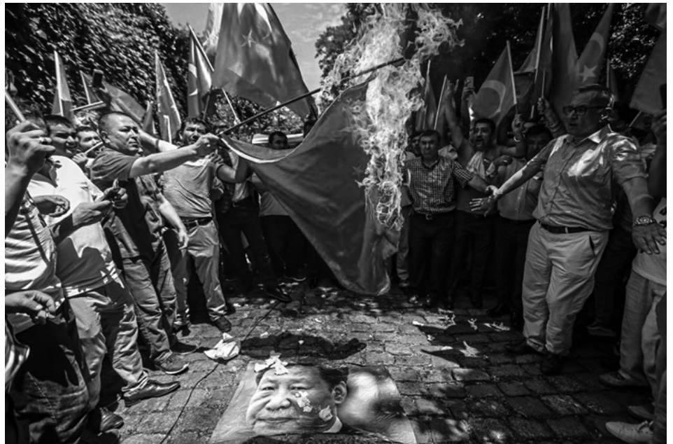
Vor der chinesischen Botschaft in Istanbul verbrannten Uiguren im Juli die chinesische Flagge und Poster von Chinas Staatschef Xi Jinping. (Der Standard, 6. September 2018)