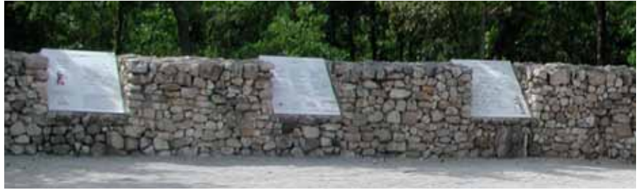
In der Provence in der Nähe von Methamis/Saint-Hubert findet man im Wald eine Erinnerungsstätte an die Pestmauer.